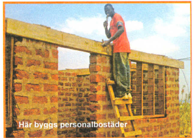
Här byggs personalbostäder

Vid mötena var det särskilt rollfördelningen mellan olika ansvariga på plats som diskuterades. Det fanns ett påtagligt behov av att klargöra och befästa inköparens roll och vi lyckades på det avslutande mötet få en