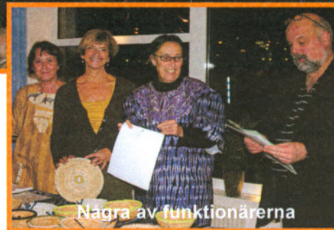
Några av funktionärerna

Konserten var inte bara en musikalisk fullträff, utan gav också ett mycket gott insamlingsresultat. Totalt resulterade evenemang-