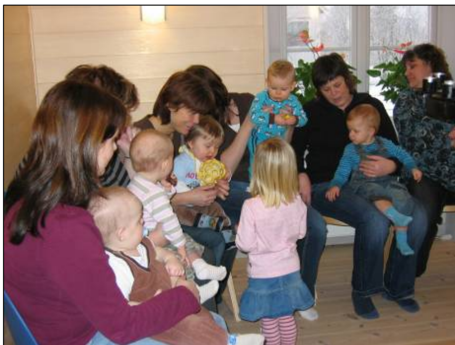
Här samlar en liten flicka in pengar i den Öppna verksamheten i Petrusgården i Jämshög in till Nduguföreningens utvecklingssamarbete.

Sedan barnverksamheten började samla in pengar till Nduguföreningen, hösten 2002, har drygt 25 000 kr skickats in till föreningen. Insamlingen görs både i Barntimmarna , som är