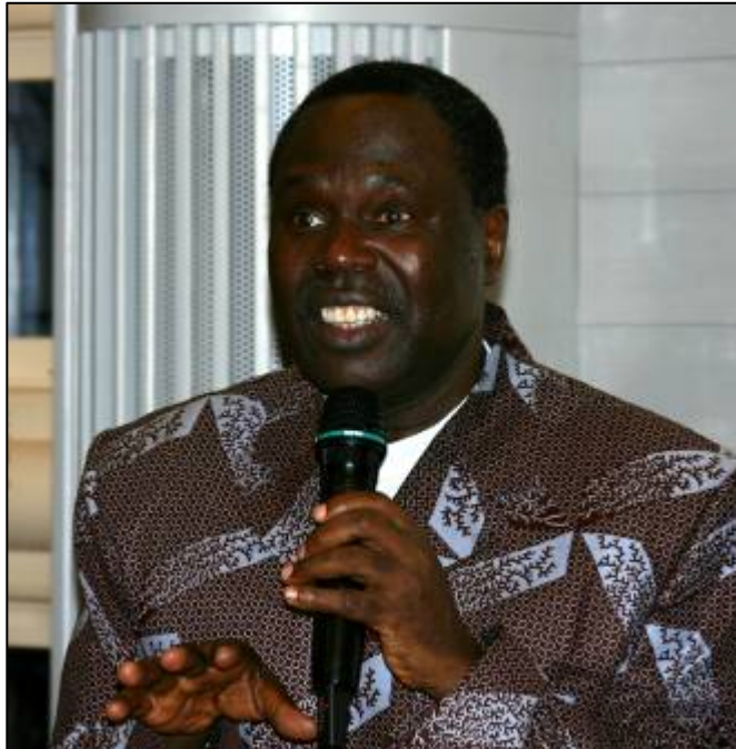
Tanzanias ambassadör dr Ben Moses redogjorde för landets politiska och ekonomiska situation och berömde Nduguföreningen för vad man redan lyckats åstadkomma i Kizagaområdet.

utvidgades denna skildring med fler tankar och intryck från dem bägge samt med ett bildspel från Kizaga. Både Ingegerd och Erica var överväldigade av den generositet de hade mötts av under sin vistelse, men också tagna av den materiella enkelhet som i mångt och mycket präglar bybornas vardag. Allra djupast intryck verkade mötet med deras respektive fadderbarn ha gjort; möten som de båda berättade ingående om.