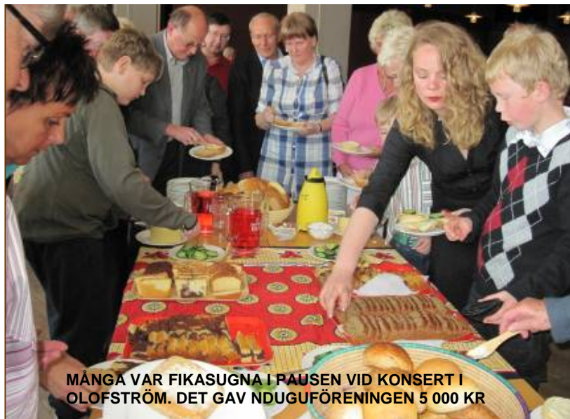
MÅNGA VAR FIKASUGNA I PAUSEN VID KONSERT I OLOFSTRÖM. DET GAV NDUGUFÖRENINGEN 5 000 KR

Återigen har Nduguföreningen haft ett gott samarbete med den Olofströmsbaserade kören Tonsättarna. Nduguföreningen ansvarade för fikaförsäljningen i samband med vårkonserten den 20 april på Folkets Hus i Olofström. Konserten samlade så många som 230 betalade och temat för evenemanget var: ABBAs fotspar . Stämningen var god i lokalen och kvaliteten hög på alla de nummer som kören framförde. På konserten deltog dessutom gruppen Ymse med ett högklassigt framträdande.