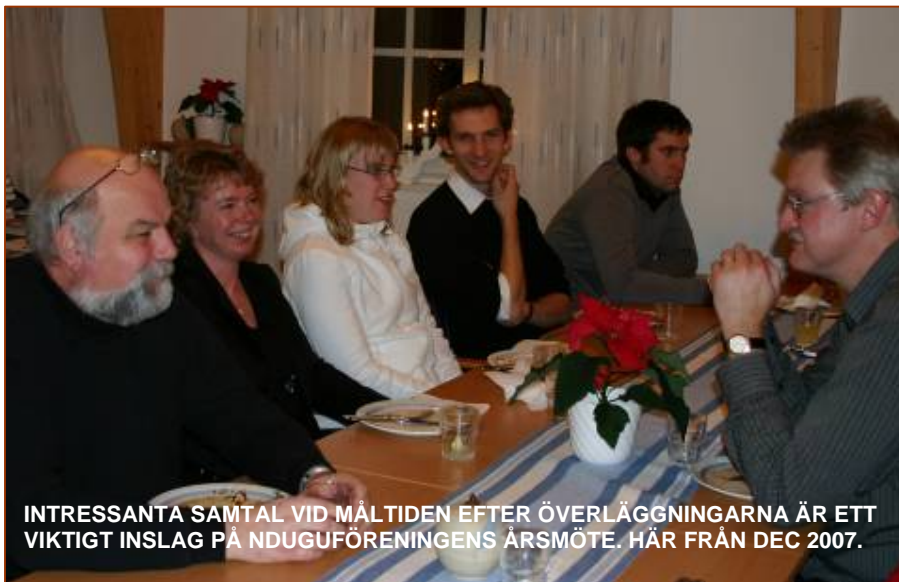
INTRESSANTA SAMTAL VID MÅLTIDEN EFTER ÖVERLÄGGNINGARNA ÄR ETT VIKTIGT INSLAG PÅ NDUGUFÖRENINGENS ÅRSMÖTE. HÄR FRÅN DEC 2007.