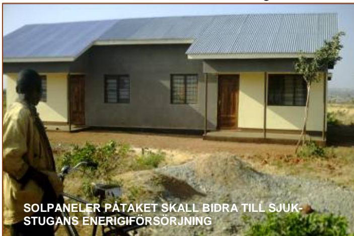
SOLPANELER PÅ TAKET SKALL BIDRA TILL SJUKSTUGANS ENERIGIFÖRSÖRJNING

Nu i mitten av juni kommer solpaneler att installeras för att ge el till sjukstugans personalbostäder. I övrigt fungerar verksamheten bra i sjukstugan, bland annat tack vare tillgången till rent vatten och den utrustning som Nduguföreningen har bidragit till.