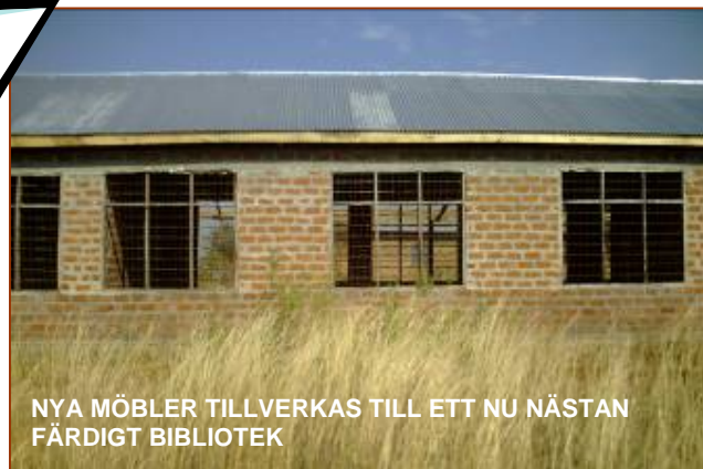
NYA MÖBLER TILLVERKAS TILL ETT NU NÄSTAN FÄRDIGT BIBLIOTEK

soner som kan bidra med våra olika perspektiv i detta utvärderingsarbete. Mer om det i nästa medlemsinfo.