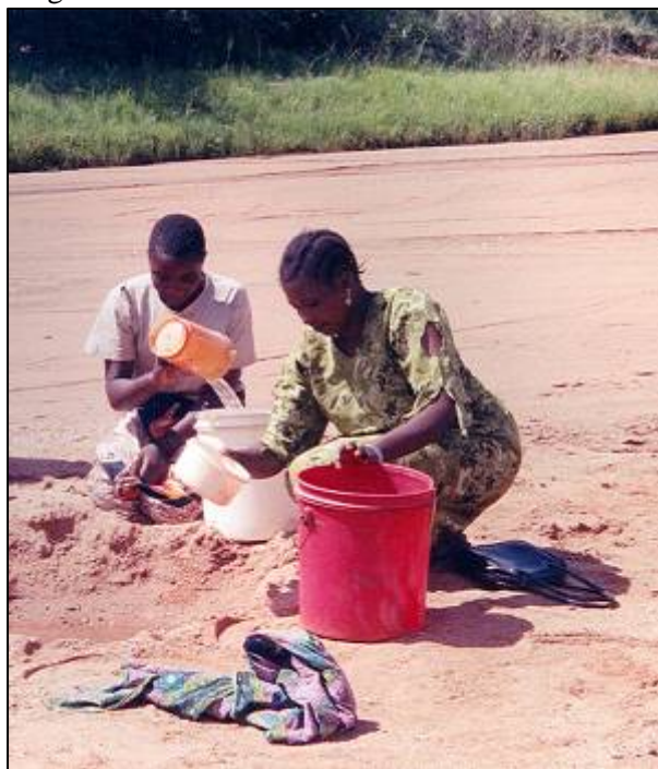
Nduguföreningen har nu beslutat tillskjuta ytterligare 20 000 kr till vattenprojektet.

I februari etablerade Nduguföreningen kontakt på högsta politiska nivå i Tanzania. I april/maj beskrivs vår verksamhet i en artikel i Aftonbladets söndagsbilaga. Dessemellan, i mars, höll vi styrelsehelg i Stockholm och fattade där en