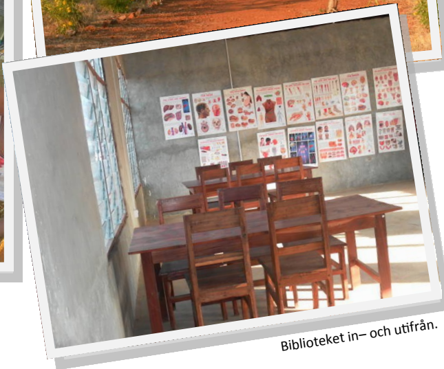
Biblioteket in- och utifrån.

Arbete pågår med att få ström till sjukstugan och biblioteket är välbesökt. Läs mer i Amon Gyundas rapport med det senaste från Kizaga.