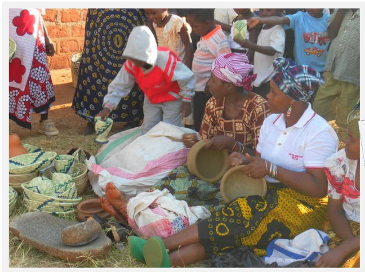
Kvinnogruppen arbetar med korgar.