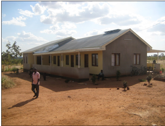
Sjukstugan ska byggas ut. Ett arbete för en bättre hälsosituation.

För denna nya insamlingsform har föreningen tagit fram en broschyr. Därtill kan företag erhålla ett diplom och synas bland annat på hemsidan. Under 2013 går intäkterna oavkortat till Nduguföreningens sjukstugeprojekt. Sjukstugan är föreningens mest omfattande projekt som görs för att uppnå en ännu tryggare hälsomässig situation i Kizagaområdet. Initiativet gäller en utbyggnad den befintliga byggnaden i Kizaga till ett så kallat health care center, ett litet sjukhus. Ett bra sammanhang för företag att