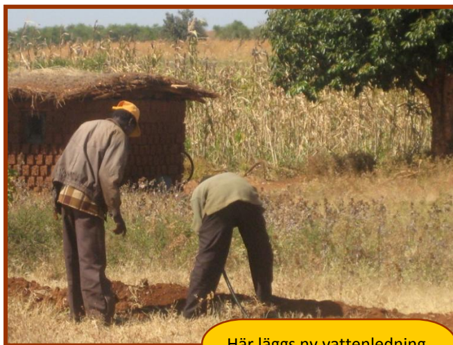
Här läggs ny vattenledning

PS .Jag hoppas att ni redan nu bokar in årsmötet den 26 mars. Vi ses väl där?!DS.