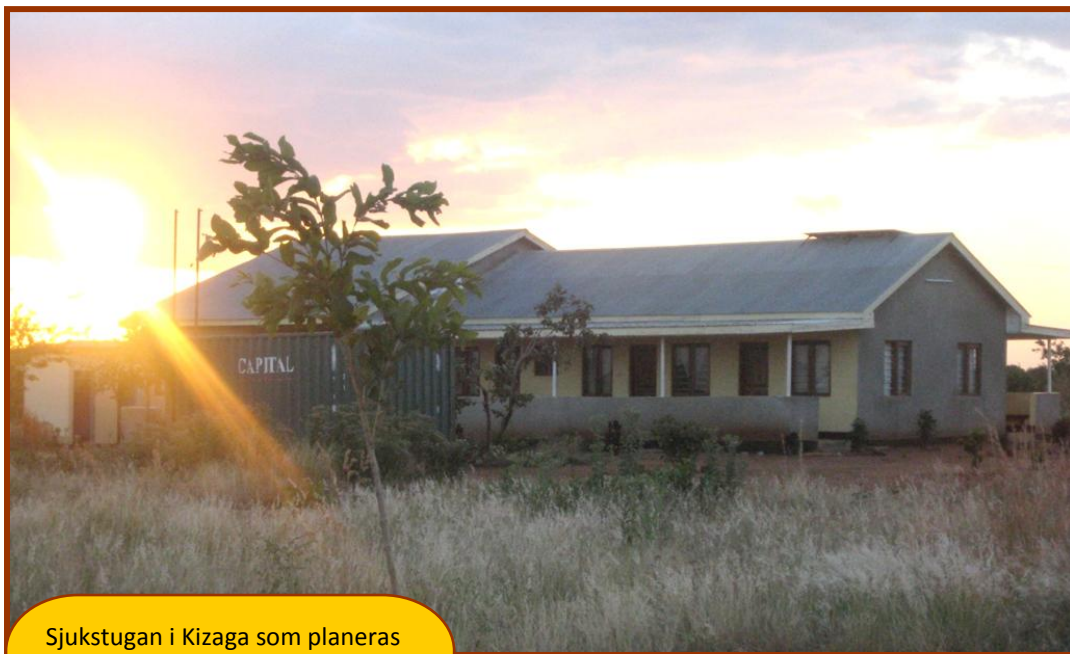
Sjukstugan i Kizaga som planeras byggas ut till ett Health Centre

ordförande ordforande@ndugu.org 0709-69 33 87